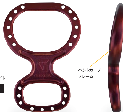
ベントカーブ フレーム